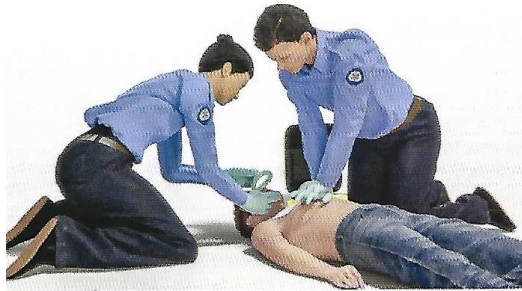
Figura 6. Si se desaconseja la descarga e inmediatamente después de la administración de la descarga, los reanimadores inician la RCP, comenzando por las compresiones torácicas.