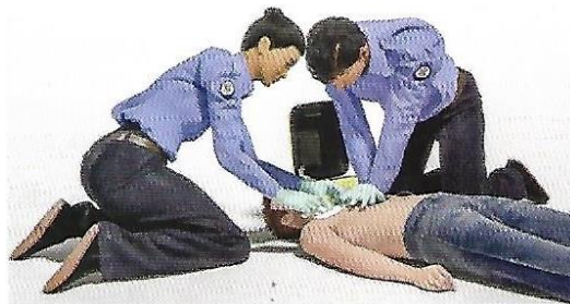
Figura 3. El reanimador coloca los parches del DEA en la víctima y después, conecta los electrodos al DEA