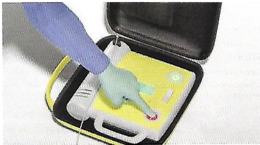
Figura 5 b. Cuando todas las personas están alejadas de la víctima, el operador del DEA pulsa el botón de descarga