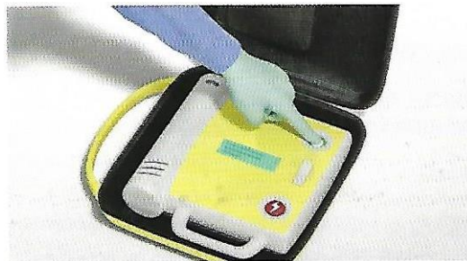
Figura 1. Enciende el DEA