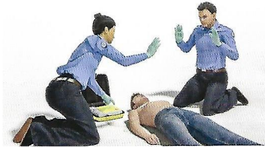
Figura 5 a. El operador del DEA ordena alejarse de la víctima a todos los presentes antes de administrar una descarga