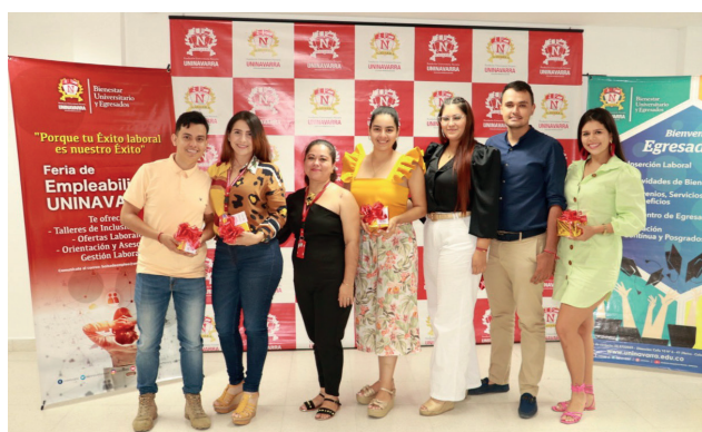
Egresados Ingeniería Ambiental