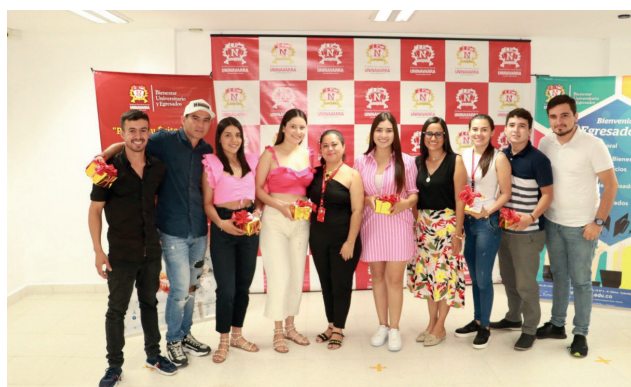
Egresados Ingeniería Industrial