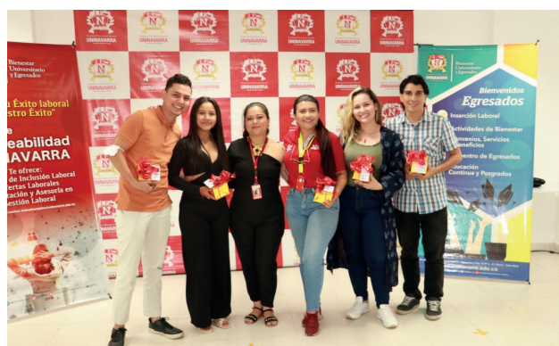
Egresados Administración de Empresas